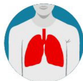
Dificultad para respirar**

*Las personas infectadas no necesariamente presentan todos los síntomas. En algunos casos, pueden no tener ninguno.