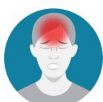
Dolor de cabeza